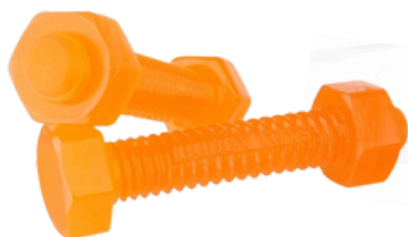
Brinquedo nylon flex