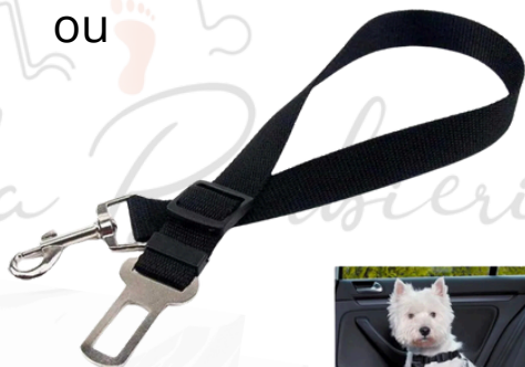
Cinto de segurança