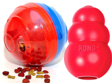
Dispenser de alimento