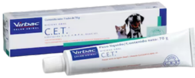
Pasta de dente enzimática