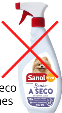
Evite: Banho a seco e perfumes