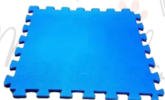
Tapetinho de EVA