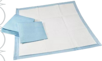
Tapete Higiênico Descartável