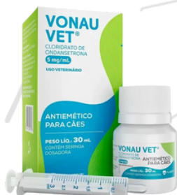
Anti emético (vômito)