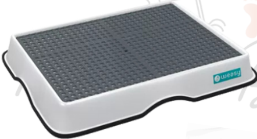
Weasy (?) Requer adaptação