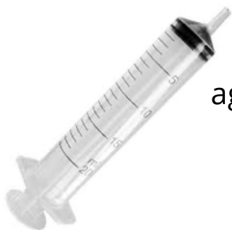
Seringa sem agulha pra medicar