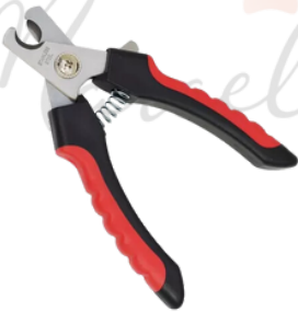
Cortador de unha