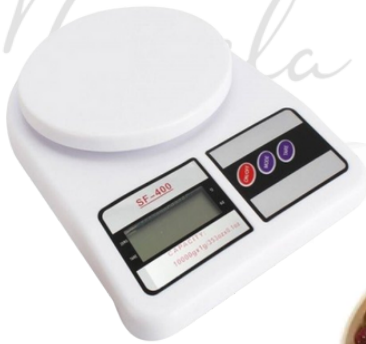
balança para pesar a ração