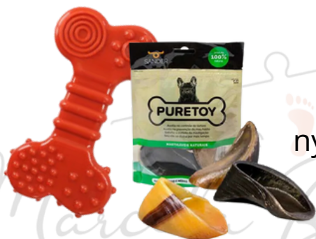
Brinquedo nylon duro e casco