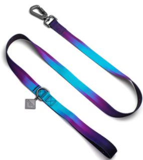
Guia de 1,5 a 2 m