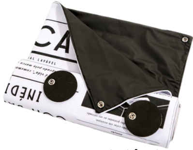
Tapete Higiênico Lavável com fixador